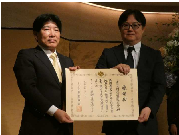
石川県不動産鑑定士協会（神田会長）